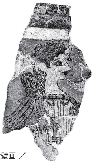
クノッスス宮殿壁画 ↗